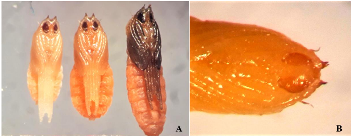
Hình 4. Nhộng sâu năn

(A). các giai đoạn phát triển, (B). hàng gai ở phần đầu nhộng.