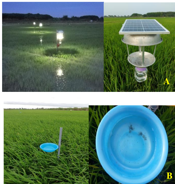
Hình 7. Dự báo sự xuất hiện của thành trùng sâu năn trên ruộng lúa.

(A). Bẫy đèn đơn giản, tự động bật-tắt, được cắm trực tiếp trên ruộng lúa, sử dụng tấm pin năng lượng mặt trời (35x40 cm; 20W, 6V), đèn LED trắng - xanh (50 - 100W).