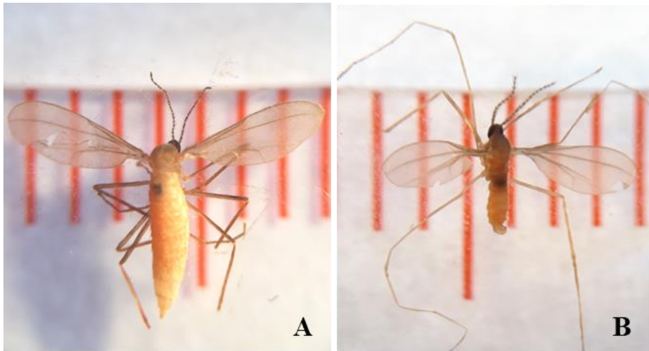
Hình 1. Thành trùng sâu năn cái (A) và đực (B)

- Thành trùng sâu năn hay còn được gọi là muỗi hành ở các địa phương vùng đồng bằng sông Cửu Long có thể được nhận biết qua một số đặc điểm hình thái cơ bản như mô tả ở Hình 1. Thành trùng sâu năn cái có chiều dài thân 3,8 - 5,5 mm, sải cánh rộng 7,1 - 8,6 mm, phần bụng có màu đỏ da cam và căng phình ra. Thành trùng đực có kích thước cơ thể nhỏ hơn thành trùng cái với chiều dài thân 2,1 - 3,4 mm, sải cánh rộng 6,0 - 7,9 mm, hình dạng tương tự như trưởng thành cái, phần bụng thường có màu vàng nâu và thon.