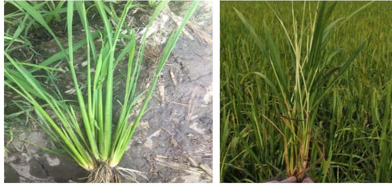
Hình 6. Triệu chứng gây hại của sâu năn khi cây lúa bị mất đọt, dễ nhánh bất thường và tạo “ống hành”