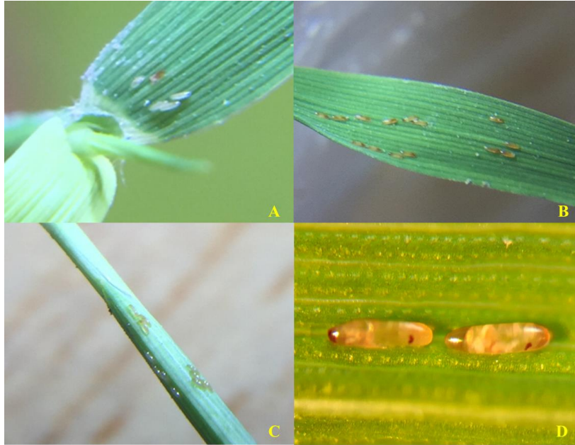
Hình 2. Trứng sâu năn mặt lá và thân lúa

- Ấu trùng mới nở có màu trắng sữa, chiều dài thân 0,36 - 0,56 mm, rộng 0,09 - 0,17 mm (Hình 3A). Khi lớn đủ sức ấu trùng sâu năn có màu trắng hồng, chiều dài thân 2,35 - 4,25 mm, rộng 0,78 - 1,10 mm (Hình 3B).