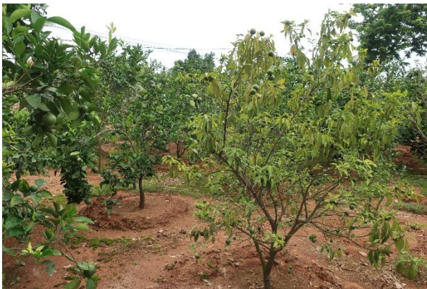
Hình 4. Cây cam bị vàng lá thối rễ