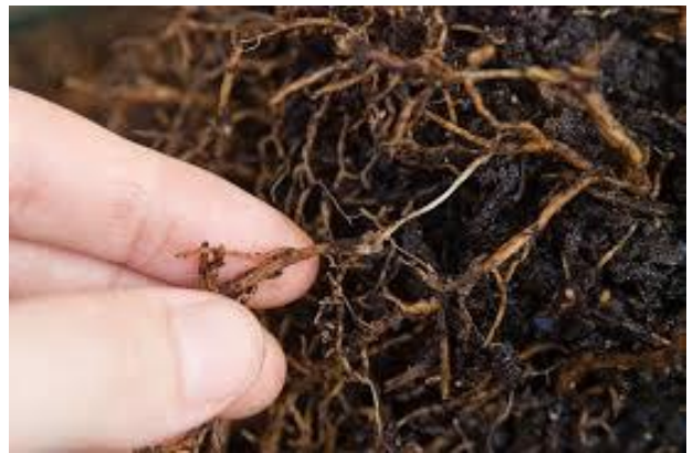
Hình 5. Rễ cây bị thối