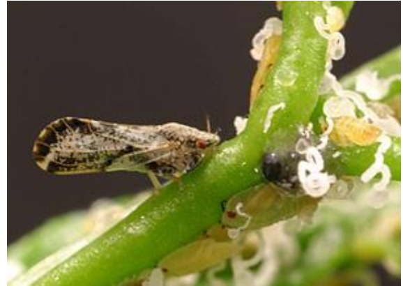
Hình 2. Rầy chổng cánh là môi giới truyền bệnh Greening