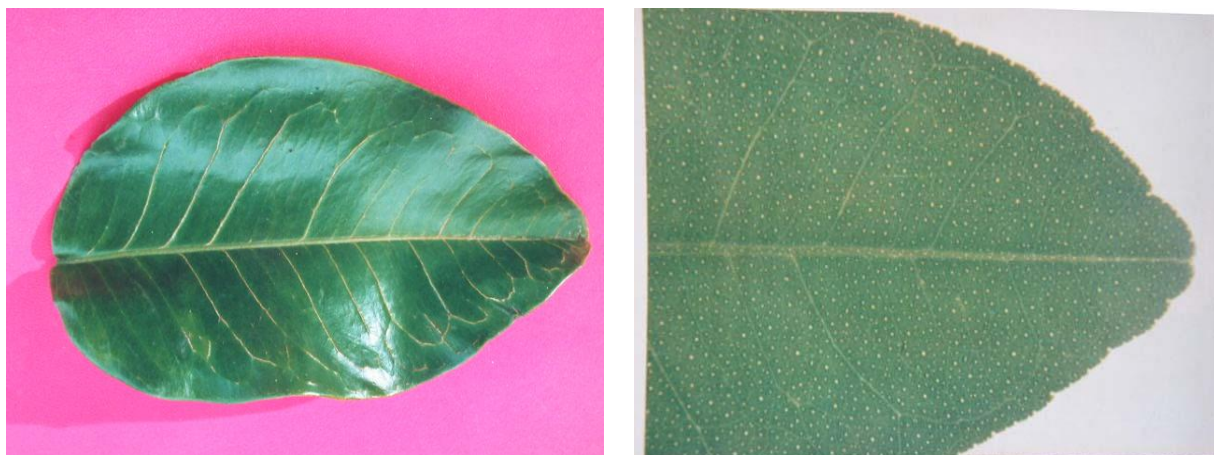
Hình 6. Triệu chứng gân lồi và gân trong