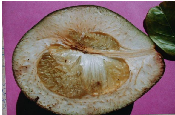
Hình 3. Quả cam trên cây bị bệnh Greening