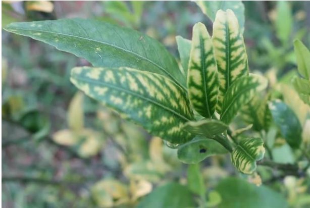
Hình 1. Lá cây bị bệnh Greening